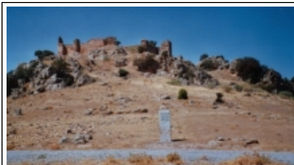
Castillo de Santa Eufemia