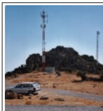
Explanada de Santa Eufemia (CO) con los postes de Airtel y Amena