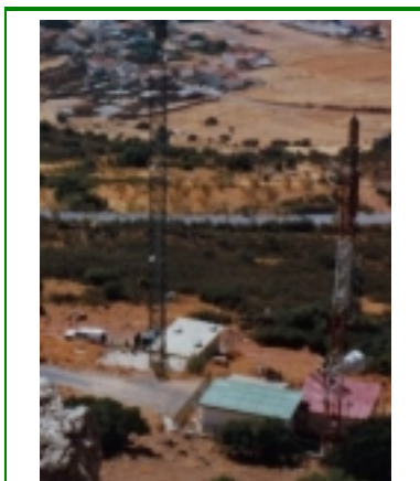
Emisores de Sandetel y Retevisión en Santa Eufemia