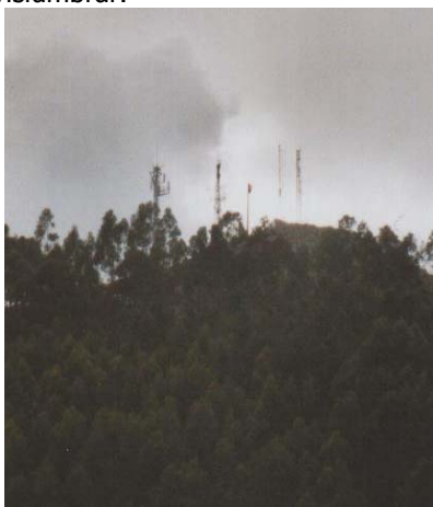
Emisoras Castro Urdiales

Para matar el rato, comprobé el dial de Castro, tanto en radio como en TV, experimentando en FM las interferencias y las espúreas que se producen al estar en las cercanías de un "centro emisor"; al lado del piso de mi amigo hay una pequeña colina donde se encuentran 5 emisoras: 1 de telefonía móvil, 1 de Retevisión, 1 de (supongo) la televisión local, y los 2 de radio comercial del pueblo; en la foto se pueden ver, o al menos vislumbrar.