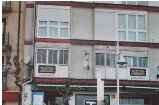
SER CASTRO URDIALES

pude comprobar que los emisores de radioenlace y la parabólica de recepción satélite, los tiene justo al lado de las ventanas que da a la calle (se puede ver en la foto que hice al día siguiente), cosa que me pareció extrañísima, ya que creo que afean la fachada.