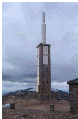
Centro transmisor de Radio Nacional de España en la Peña de Francia. Las antenas emisoras están dentro del cilindro blanco.

Después de comer en La Alberca y comprar algunos botes de miel propia de la zona, subimos a la espectacular Peña de Francia. En su cumbre a 1.732 m. de altura además de un parador, un mirador donde poder deleitarse con las vistas y un enorme reloj de sol, podéis encontrar también el centro de transmisión de Radio Nacional de España. Allí desplegamos las antenas y esto es lo que pudimos oír.