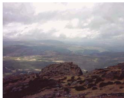
Vista (parcial) desde la Peña de Francia. Lo de parcial es porque queda muchísimo más que no cabía en la foto. Tenéis que verlo vosotros mismos.

Como se puede ver, hay algunas emisoras sin identificar completamente. Cualquier información que nos ayude a completar la lista será bienvenida.