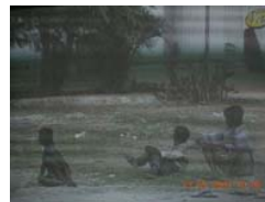
CANAL 33 TV

C-51 La emisora de Castellón que hace interferencias a CANAL 33 Valencia (51 UHF) desde diciembre se llama IN TV, curiosamente se anuncia en la R. FM (92'5) de Castellón. (ICM).