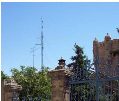
Antenas para el enlace de los estudios de RNE en Salamanca con el centro emisor. A la derecha asoma la Torre del Clavero.

emisora en la capital burgalesa. Oficialmente sus emisiones en la onda media (855KHz) empezaron en el mes de septiembre de 1985, tras el correspondiente periodo de pruebas. Unas semanas más tarde, el 19 de octubre, se iniciaron oficialmente las