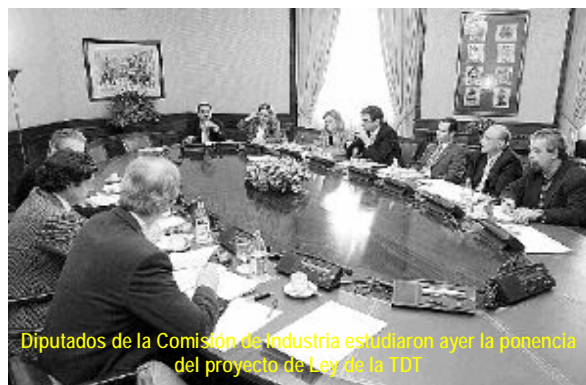
Diputados de la Comisión de Industria estudiaron ayer la ponencia del proyecto de Ley de la TDT

El hecho de que este límite no suponga la anulación del artículo del controvertido proyecto de Ley, que permite a un mismo concesionario controlar cinco emisoras, frente a las tres actuales, o hasta un 50 por ciento de un mismo ámbito de cobertura, es interpretado por los expertos consultados por LA RAZÓN como un intento de disfrazar de pluralismo una apuesta decidida por el aumento de los límites a la con-